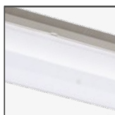
HLA: klosz PC