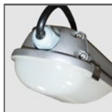
TPA: klosz PC

LED DUSTPROOF FIXTURE LED-LEUCHTEN СВЕТОДИОДНЫЙ СВЕТИЛЬНИК LED SVÍTIDLO