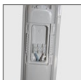
HLA: łączenie przelotowe