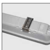
HLA: uchwyty montażowe