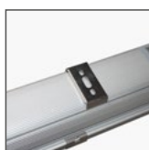
TPA: uchwyty montażowe