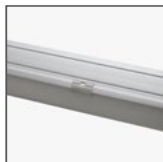
TPA: metalowe klipsy